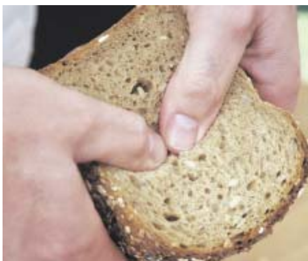
Scheibenweise Kohlenhydrate bietet Brot.

schen wurde weniger die Umstellung auf eine kohlenhydratreiche Ernährung, sondern vielmehr der Verzehr übergroßer Portionen und auch der Mangel an Bewegung angesehen.