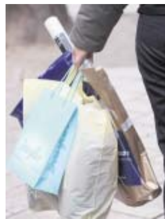
800 000 Menschen leiden hier zu Lande unter Kaufsucht.

Pro Stunde sollten die Pflegebedürftigen ein Glas kühles Wasser, Saft oder Brühe zu trinken bekommen.